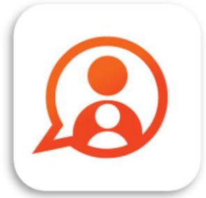
Konnect OuderApp Konnect B.V.

Gegevens niet ontvangen? Neem dan contact op met de kinderopvangorganisatie, zij kunnen nieuwe gegevens sturen.